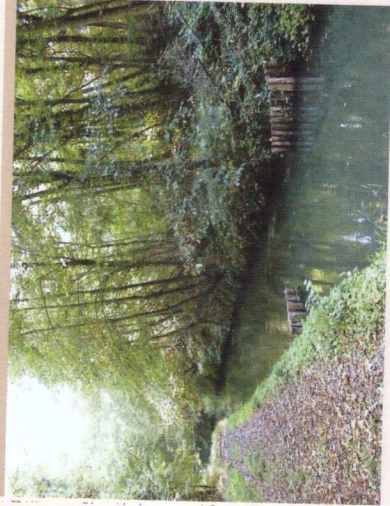
LA VIOSNE

Zone humide essentiellement constituée de roseaux communs poussant sur un milieu assez tourbeux, cette