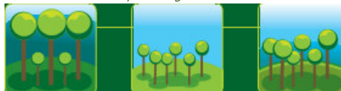
Une forêt d'arbres vieillissants